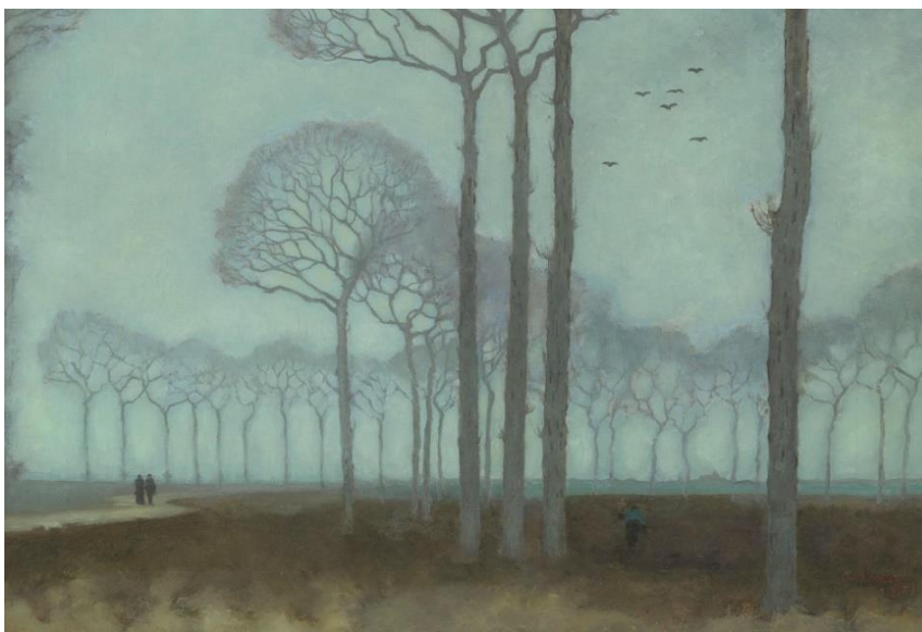
"Bomenrij" door Jan Mankes.