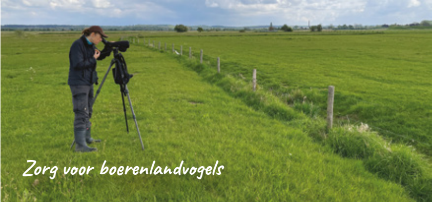
Zorg voor boerenlandvogels