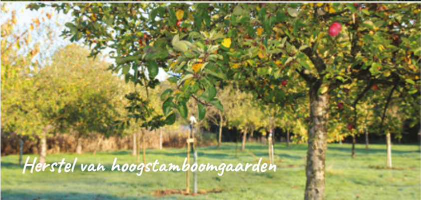
Herstel van hoogstamboomgaarden